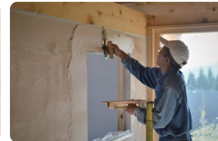
シラス壁 シラス（火山灰）を使った左官壁で、調湿・消臭性に優れています。