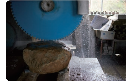
石 大黒柱を支える束石は能登島の石。