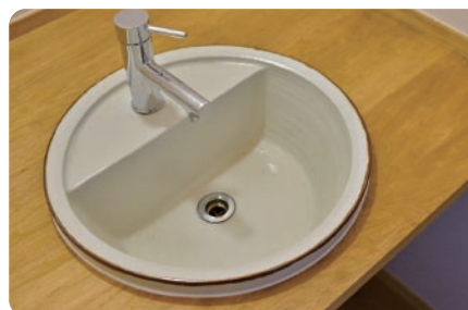
家具 家具職人が作るオーダーメイドの家具。能登島の陶芸家が作る洗面鉢。