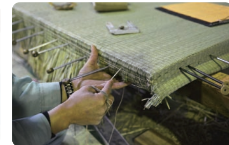
畳 自家製藁2年分を使った藁床に国産草の畳表でオーダーメイドした畳。