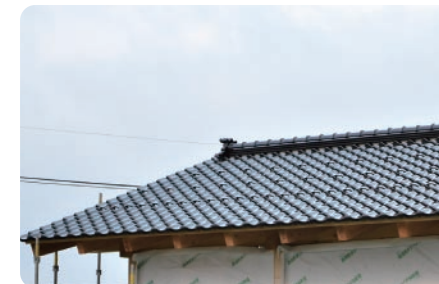
瓦 能登島の家並に合わせた黒瓦の屋根。