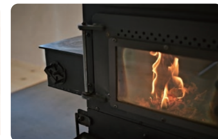
薪ストーブ 能登のストーブ屋さん「金森ストーブ」が作るオープンがついた薪ストーブ。