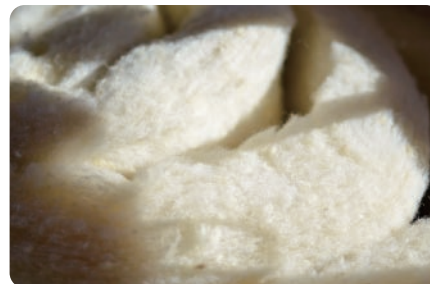
羊毛 断熱材に使用しているのは調湿製のある断熱材・ウールプレス。