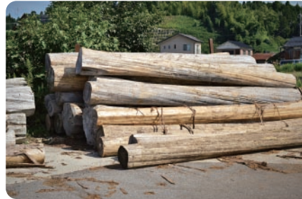
アテ 構造材は主に地元のアテ（能登ヒバ）と杉。