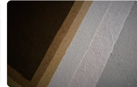
和紙 珪藻土を漉き込んだ能登仁行和紙の壁紙。