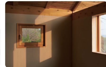
窓 アテ（能登ヒバ）で作った木製窓、アルミ樹脂複合サッシを併用しています。