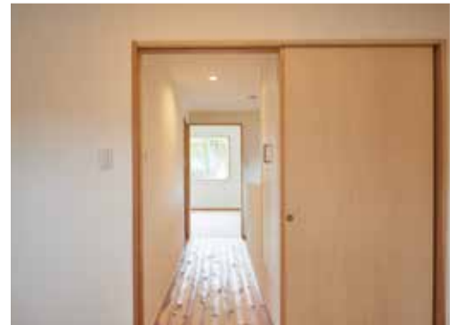
床は無垢のフローリング、壁は卵の殻 を再利用したエッグウォールを採用。

仕様 木造2階建て 外装：屋根／ガルバリウム 外壁／ジョリパット（前面）・ガルバリウム（側面・裏面） 内装：天井／塗装・エッグウォール 床／無垢フローリング（スギ・アテ） 壁／エッグウォール・デュブロン 断熱材：パーフェクトバリア 窓：YKK APW310 / 430 設備：Panasonic（風呂、トイレ） Sanwacompany（キッチン）