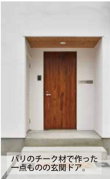
バリのチーク材で作った 一点ものの玄関ドア。

施主のこだわりポイント お客様のこだわりで、白を基調としたシンプルな空間の中に、バリ直輸入の建具や小物を配置しました。