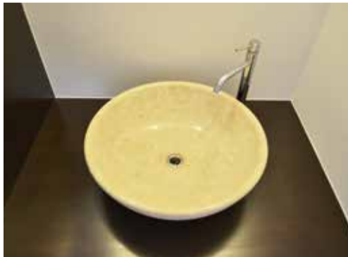
洗面脱衣室には、バリ直輸入の大理石の 洗面器。