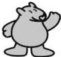
リファインキャラクター ウオンパッド